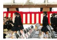
新入生退場の様子