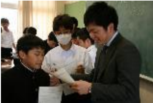
4月21日 オープンスクール 授業風景