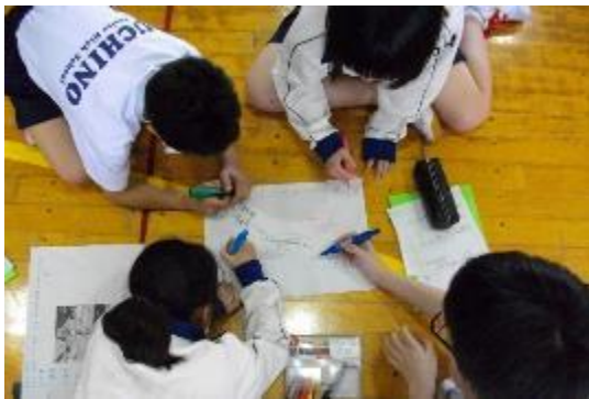
5月23日 1年ファシリテーション講座