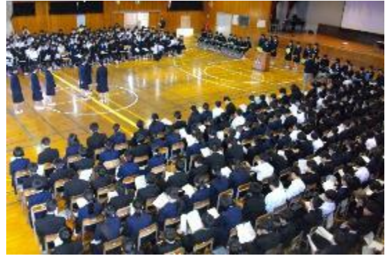
5月21日 生徒総会・いじめ根絶絆集会