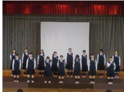
新入歓迎会 部活動紹介