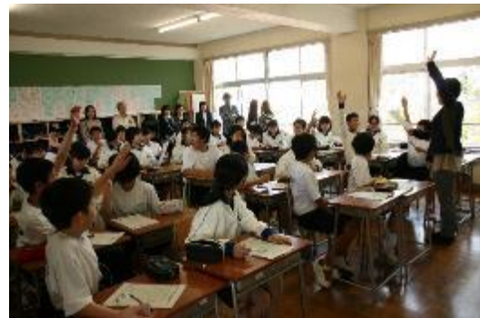
4月21日 オープンスクール 授業風景