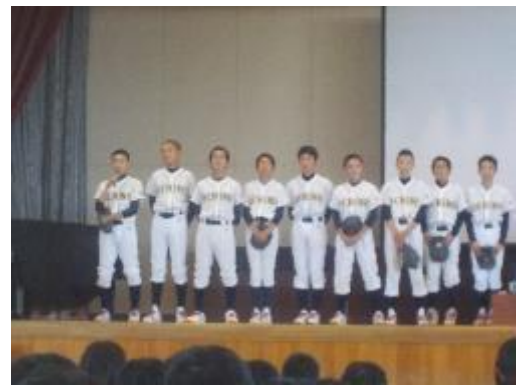
6月8日 市内大会激励会