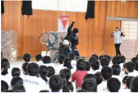
5月18日 交通安全教室 スタントマンを呼んでの実演