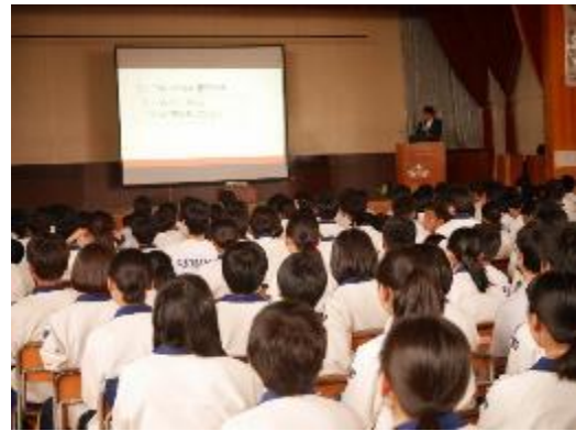
5月28日 ネット講演会