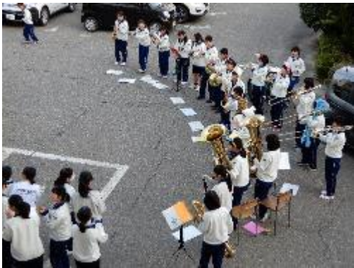
部活動見学 仮入部