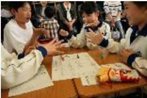
4月21日 オープンスクール 授業風景